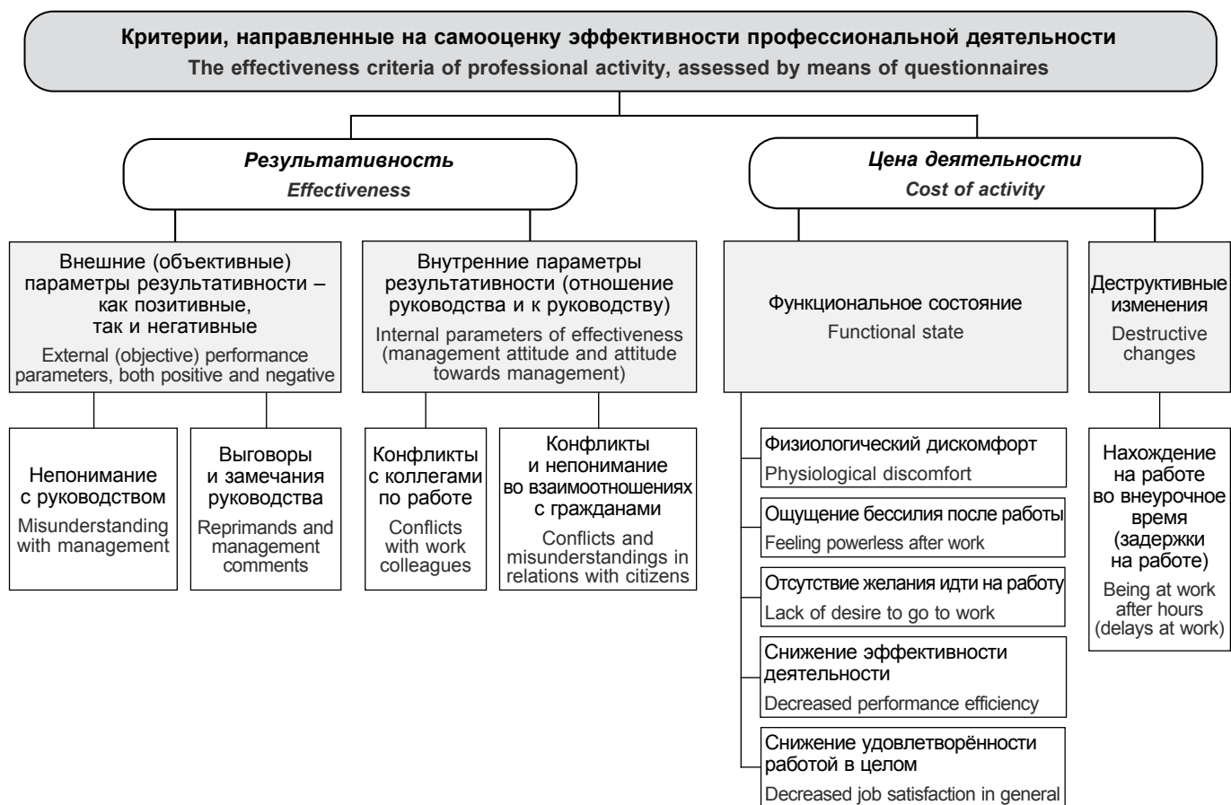
Рис. 2. Критерии эффективности профессиональной деятельности, оцениваемые средствами анкетирования.