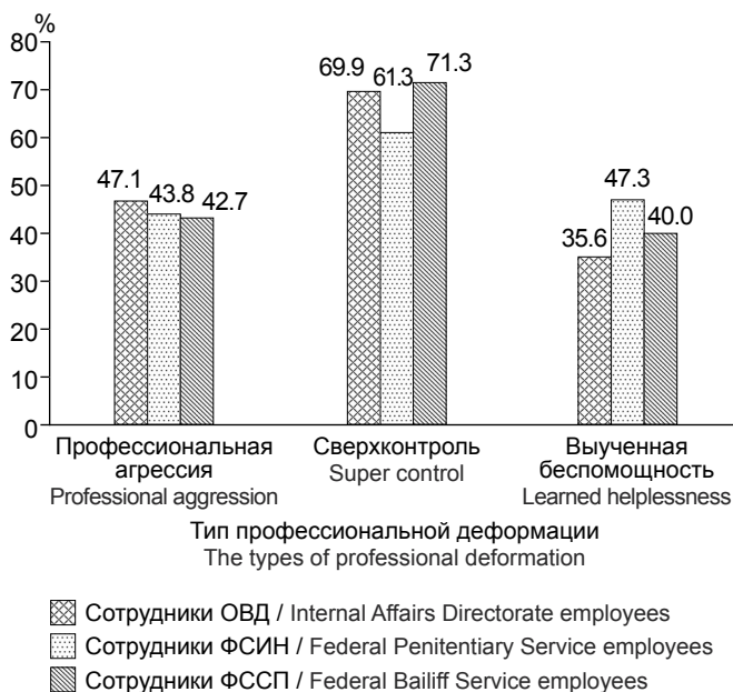
Рис. 3. Выраженность (% от максимально возможного балла) различных видов профессиональной личностной деформации у сотрудников ОВД, ФСИН и ФССП по итогам применения MANOVA ( n = 113 ).

Fig. 3. The severity (% of the maximum possible score) of various types of professional personal deformations in the Internal Affairs Directorate, the Federal Penitentiary Service and the Federal Bailiff Service employees based on the MANOVA application results ( n = 113 ).