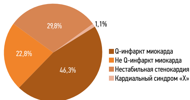
Рис. 1. Распределение по формам острого коронарного синдрома.

Данные о пациентах были получены из электронных медицинских карт, которые содержат врачебные