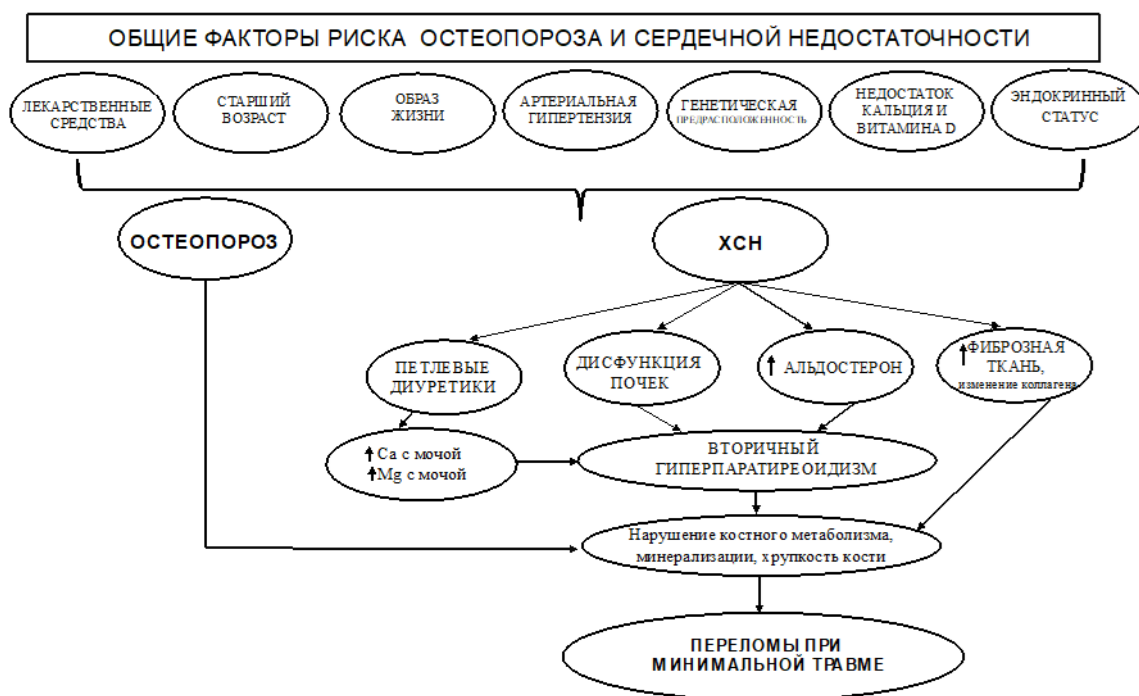
Рис. 1. Общие факторы риска развития хронической сердечной недостаточности и остеопороза.

сахарный диабет, старший возраст, курение, артериальная гипертензия, малоподвижный образ жизни, дефицит эстрогенов, активация воспалительных медиаторов и прочее (рис. 1), необходимо создание методов скрининга или обучения пациентов сохранению здоровья с точки зрения остеопороза или риска развития низкотравматичного перелома.